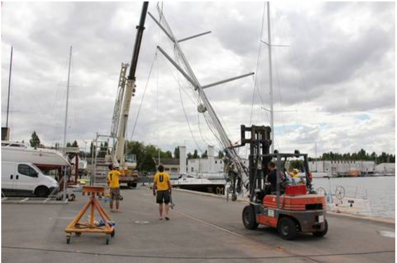
Le mât du bateau se dresse pour être fixé.